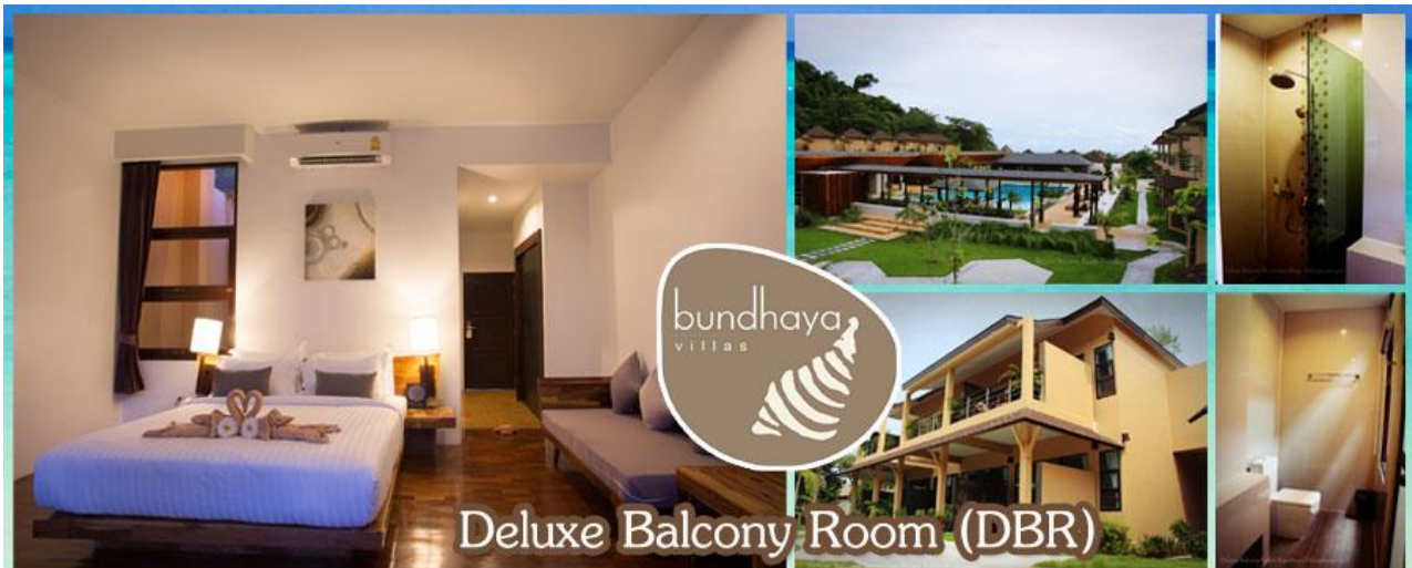
Deluxe Balcony Room (DBR)